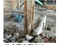
柱の下の部分は腐っていました