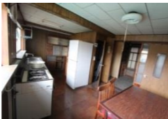
解体前のキッチン