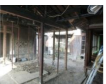
すべて解体し、柱のみに